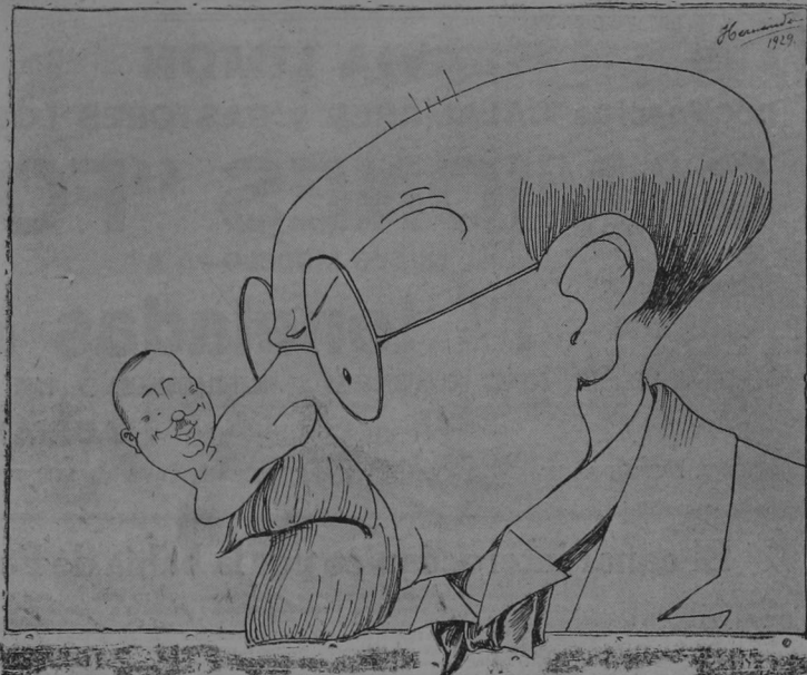
¡Sería cosa de renunciar si me saliera ese grano en la nariz!!